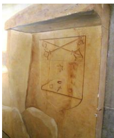
Blason de la paroisse.