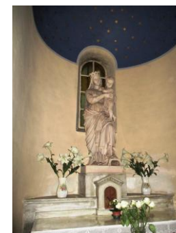
Statue de la Vierge

Sur le devant de l'autel on peut remarquer des mosaïques de style néo-byzantin contemporaines de celles qui existaient sur la voûte du chœur.